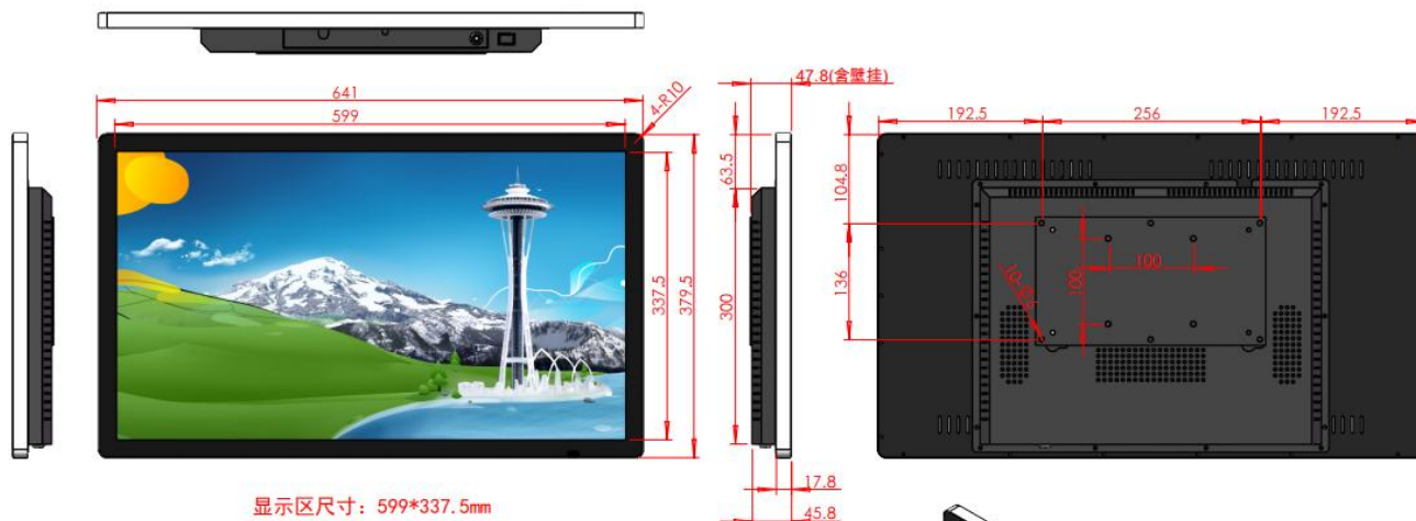
A8款 27寸广告机尺寸图